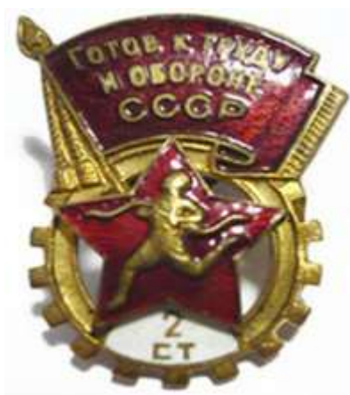
ЗНАЧОК «БУДЬ ГОТОВ К ТРУДУ И ОБОРОНЕ»