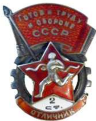
ЗНАЧОК «ОТЛИЧНИК ГТО» 2 СТУПЕНИ 1940-1946 ГОДОВ (СЕРЕБРО)