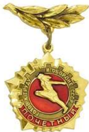
ПОЧЕТНЫЙ ЗНАК ГТО