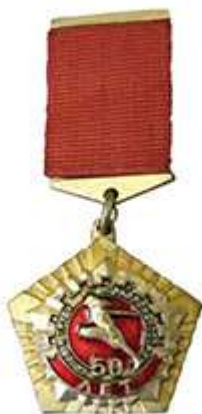
ЗНАК «50 ЛЕТ КОМПЛЕКСУ ГТО»

В 1981 году, к 50-летию комплекса ГТО, Комитетом по физической культуре и спорту при Совете министров СССР и ЦК ВЛКСМ был выпущен специальный наградной знак.