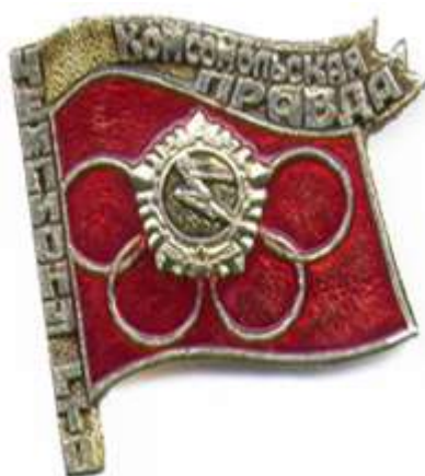
ЗНАЧОК «ЧЕМПИОНУ ГТО», ТБИЛИСИ, 1977 ГОД