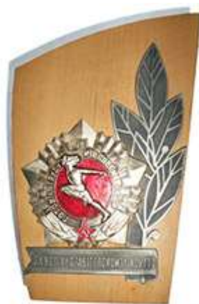
ЗНАК «ЗА УСПЕХИ В РАБОТЕ ПО КОМПЛЕКСУ ГТО»