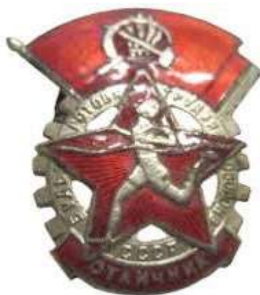
ЗНАЧОК ГТО 1 СТУПЕНИ