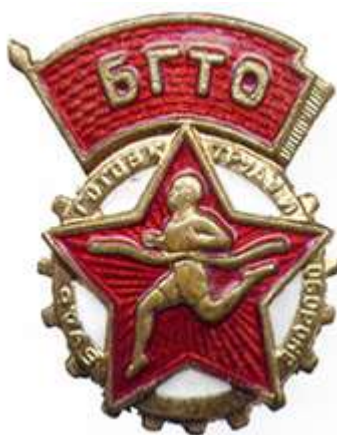
ЗНАЧКИ ГТО II СТУПЕНИ 1946–1961 ГОДОВ

В послевоенное время, когда страна оправлялась после потрясений, комплекс ГТО продолжал модернизироваться в соответствии с задачами, стоящими перед физкультурным движением того времени. Введенный в 1946 году комплекс ГТО характеризовался сокращением количества нормативов (БГТО — до 7, ГТО I и II ступеней — до 9), установлена взаимосвязь между этими нормами и программами физического воспитания школ и учебных заведений, уточнены и изменены возрастные группы.