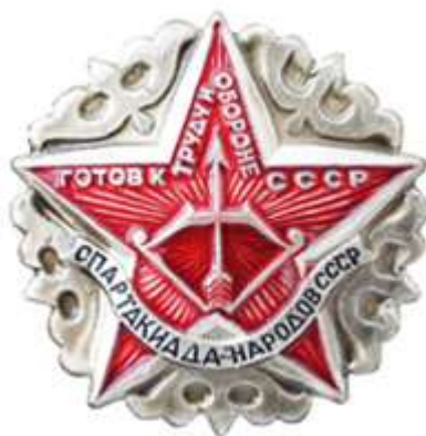
ЗНАЧОК РЕГИОНАЛЬНЫХ СОРЕВНОВАНИЙ" ГТО — СПАРТАКИАДА НАРОДОВ СССР«