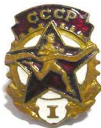
ЗНАЧОК «БУДЬ ГОТОВ К ТРУДУ И ОБОРОНЕ»