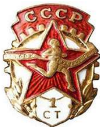
ЗНАЧОК «ОТЛИЧНИК БГТО», 1940 ГОД