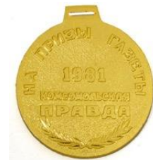
Значок и медали чемпионата СССР по многоборью комплекса ГТО на призы газеты «Комсомольская правда», Кишинёв, 1981 год