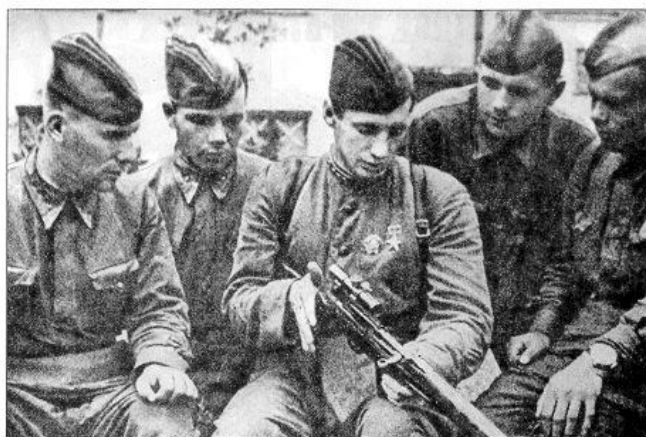
Герой Советского Союза В. Пчелинцев рассказывает бойцам о своих приемах снайперской стрельбы.