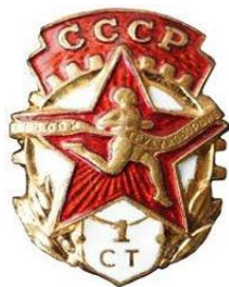
Значок «Отличник БГТО», 1940 год