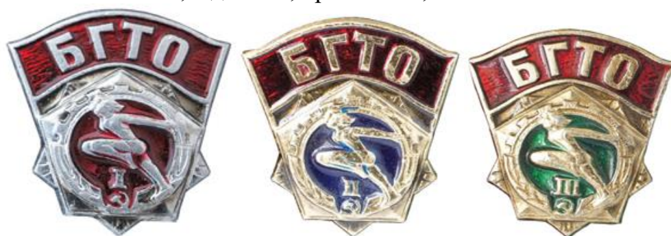
Значки БГТО I, II, III ступеней выпуска 1972 года

При выполнении нормативов Комплекса ГТО участники награждались серебряными и золотыми знаками отличия, для 5-й ступени предусматривался только золотой значок, а для 4-й, кроме того, золотой с отличием.