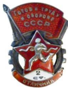
Значки «Отличник ГТО» 2 степени 1940-1946 годов (серебро и бронза)