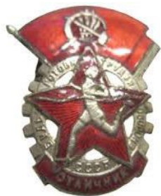
Значок ГТО 1 степени