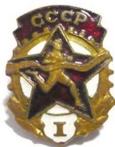
ГТО I ступень