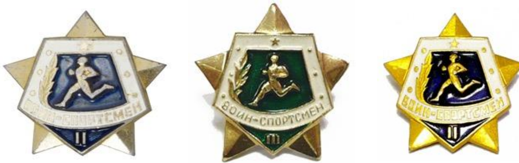
Значки «Воин-спортсмен» I, II и III ступеней, 1961 год