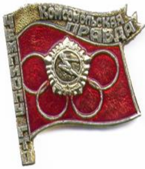
Значок «Чемпиону ГТО», Тбилиси, 1977 год