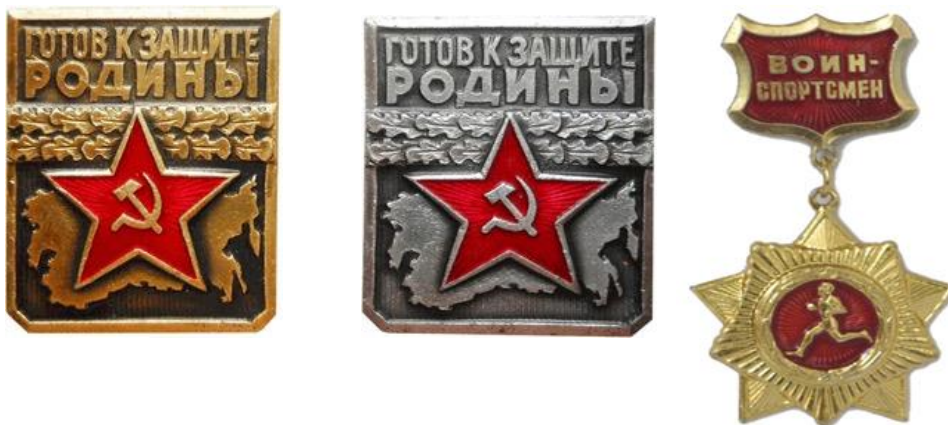
Золотой нагрудный знак «Воин-спортсмен», 1961 год

В 1966 году по инициативе ДОСААФ была разработана и введена в действие ступень комплекса ГТО для молодежи призывного возраста «Готов к защите Родины» (ГЗР).