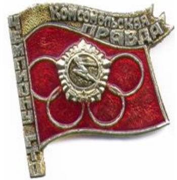
Значок «Чемпиону ГТО», Алма-Ата, 1979 год