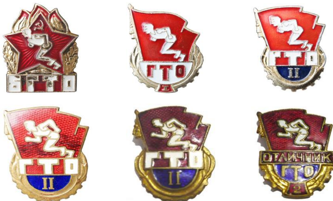
Значки БГТО и ГТО 1961 года

Обновленный Комплекс ГТО состоял из трех ступеней. Ступень БГТО - для школьников 14 - 15 лет, ГТО 1-й ступени - для юношей и девушек 16-18 лет, ГТО 2-й ступени - для молодежи 19 лет и старше.